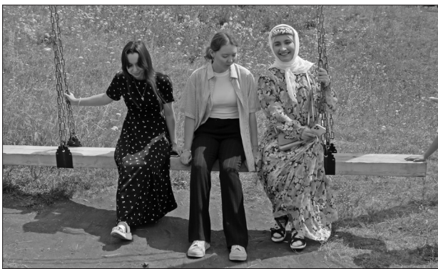
Юлсубино авылындагы «Күгәрчен чимәсе»ндә жанга да, тәнгә дә сихәт алган мизгел.